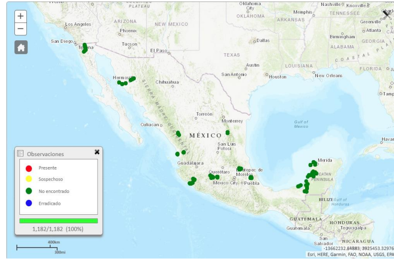
Observaciones registradas del 01 de enero al 30 de noviembre de 2024